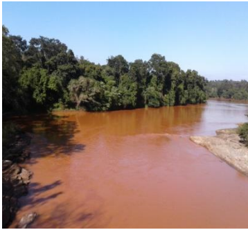
Ponte Perdida/ Rio Doce