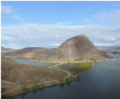
UHE AIMORÉS