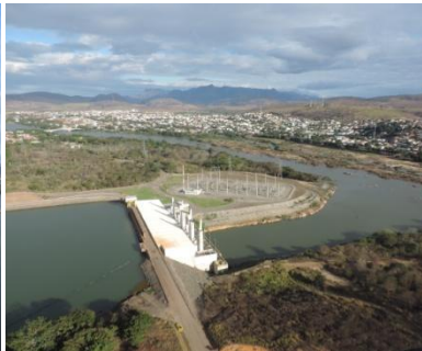
UHE MASCARENHAS