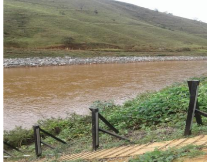
Rio do Carmo em Barra Longa