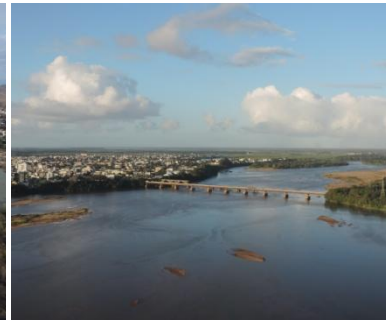
Rio Doce em Linhares (ES)