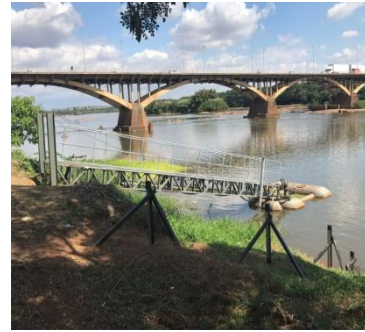
Rio Doce em Governador Valadares