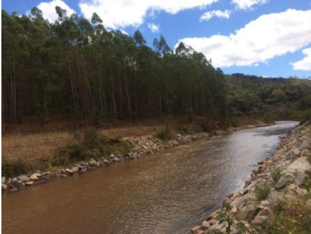
Rio Gualaxo do Norte

Pontos de monitoramento conjunto (Colaboração: Fundação Renova, IEMA) em destaque em Julho de 2017: