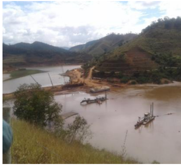
UHE Risoleta Neves/Candongu