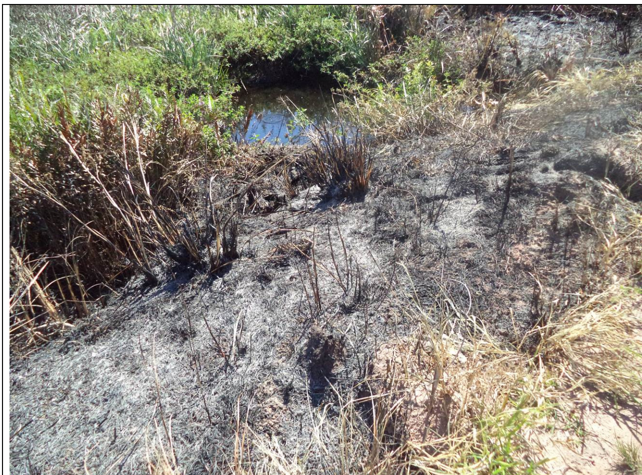
Foto 4: Constatou-se que houve combate ao incêndio realizado por terceiros, visto que o solo ao redor dos reservatórios encontrava-se bastante pisoteado.

----- Flávio Guerra Barroso Gestor PEPCV e APA de Setiba