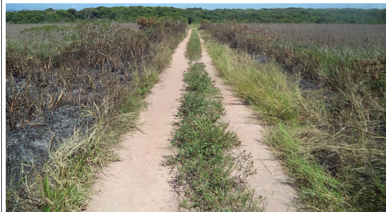
Foto 2: Incêndio no PEPCV. As margens da trilha do Tropical. Foto registrada em 22/02/2019.