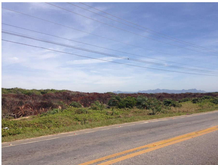
Vista parcial da área queimada.