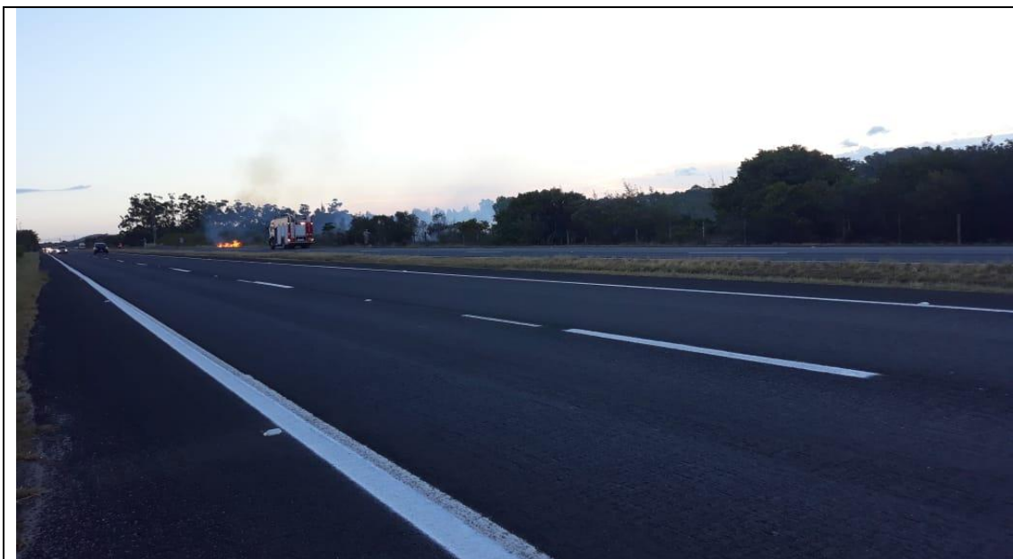
Foto 1: Incêndio dentro da APA de Setiba na ( ZORC ) Zona de ocupação rural controlada