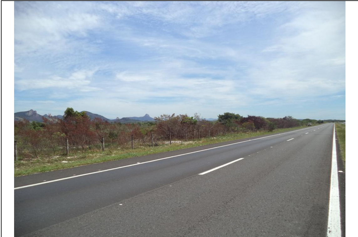
Foto 3: incêndio na APA de Setiba no KM 33 na Zona de Ocupação Rural Controlada