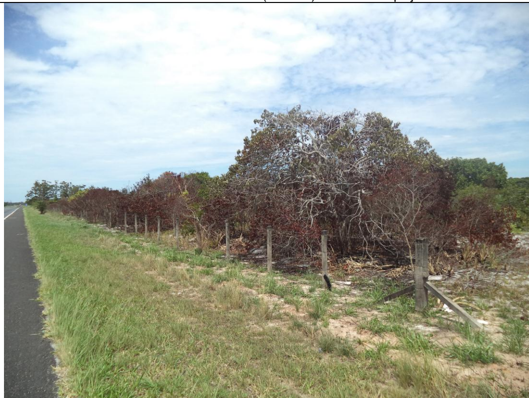
Foto 2: Incêndio no KM, 33 em frente aos eucaliptos na APA de Setiba