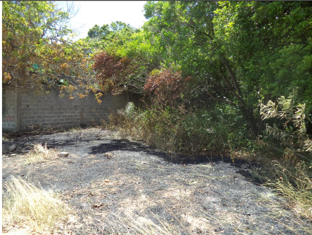
Foto 2: Incêndio no loteamento Ouro Branco, dentro da APA de Setiba. Foto de 21/01/2019.