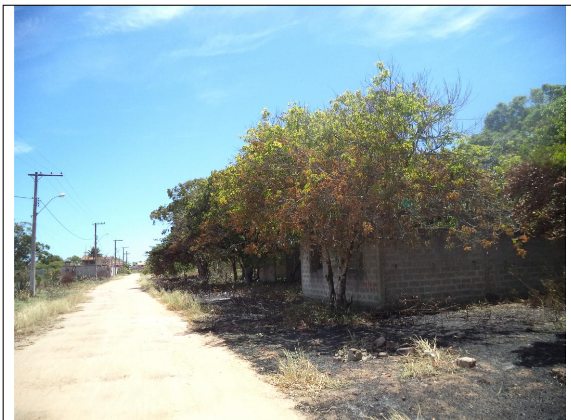
Foto 1: Incêndio no loteamento Ouro Branco, dentro da APA de Setiba. Foto de 21/01/2019.