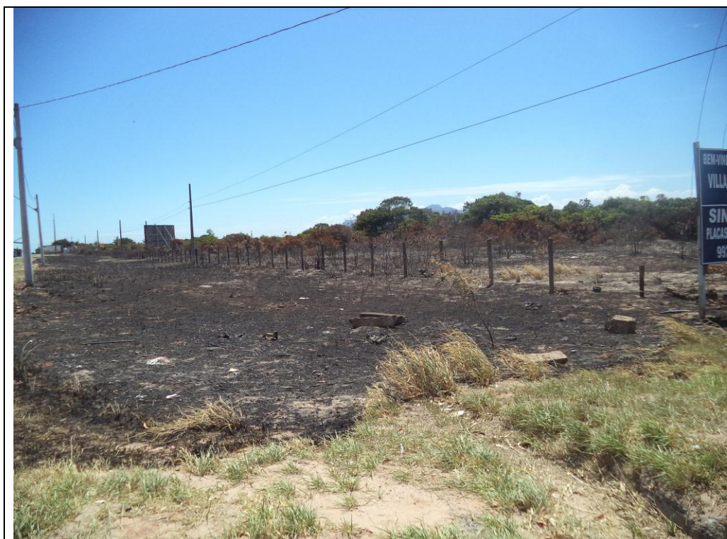
Foto 1: Incêndio na entrada do loteamento Village do Sol, dentro da APA de Setiba. Foto de 20/01/2019.