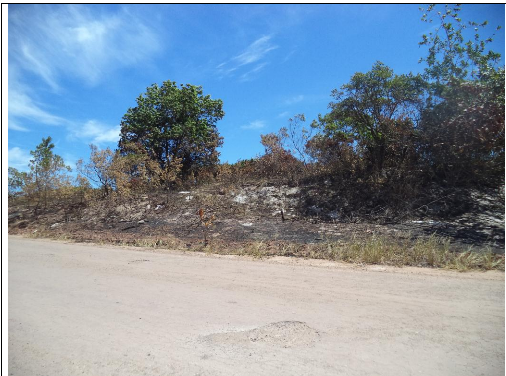
Foto 3: Incêndio na entrada do loteamento Village do Sol, dentro da APA de Setiba. Foto de 20/01/2019.