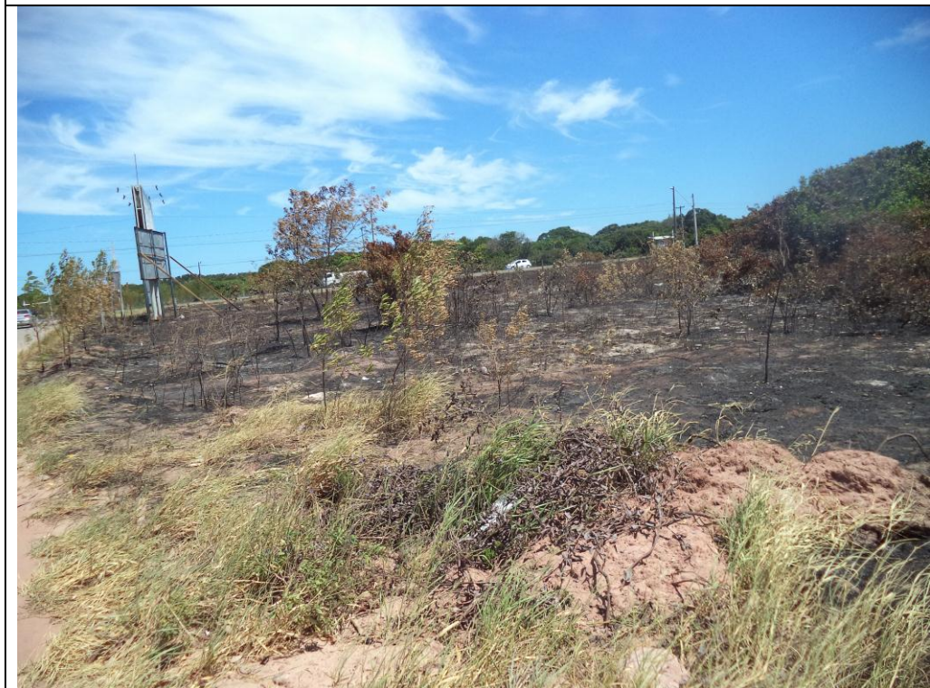
Foto 2: Incêndio na entrada do loteamento Village do Sol, dentro da APA de Setiba. Foto de 20/01/2019.