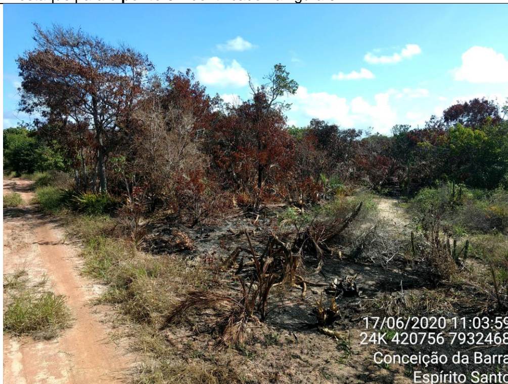
Figura 06: Destaque para o ponto 05 identificado na figura 01.