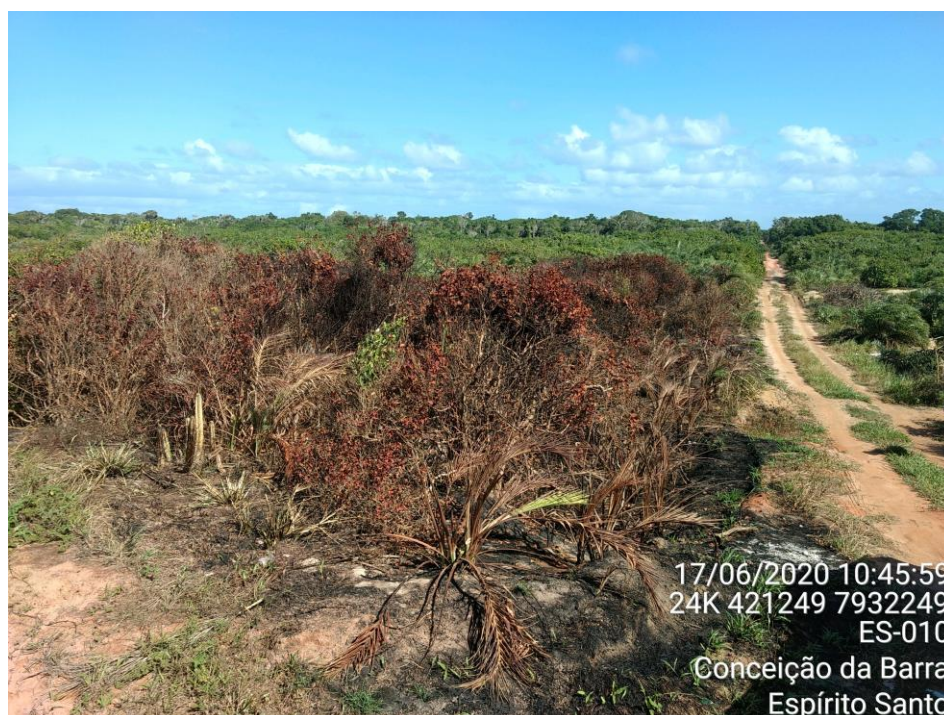
Figura 02: Destaque para o ponto 01 identificado na figura 01.