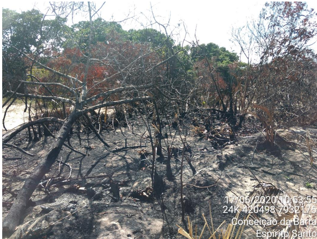
Figura 03: Destaque para o ponto 02 identificado na figura 01.