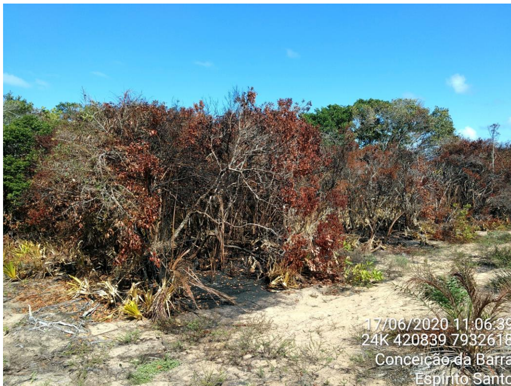
Figura 05: Destaque para o ponto 04 identificado na figura 01.