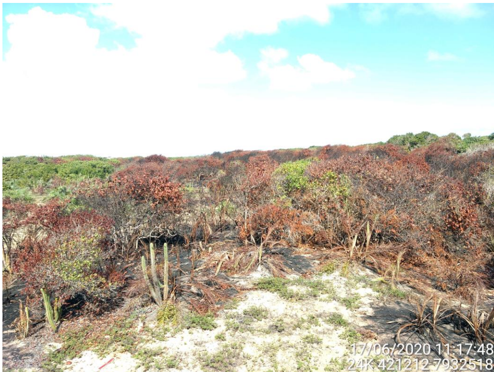
Figura 08: Destaque para o ponto 07 identificado na figura 01.