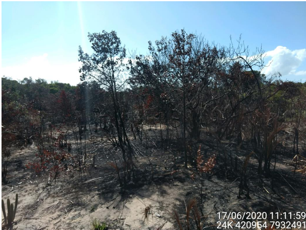
Figura 07: Destaque para o ponto 06 identificado na figura 01.