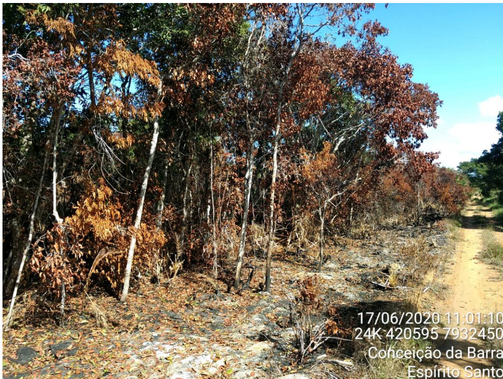
Figura 04: Destaque para o ponto 03 identificado na figura 01.