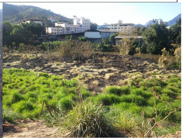
Imagem 07 e 08: Visão parcial da área queimada.