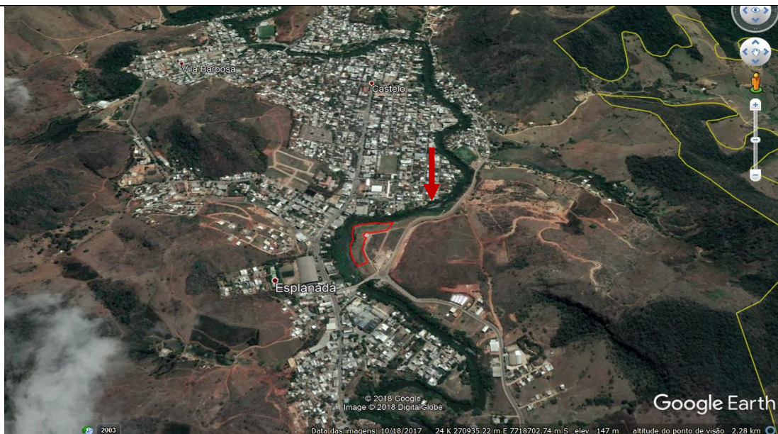
Imagem 02: (Google Earth Pro) Local do incêndio. Polígono em vermelho indicando a área queimada. Seta vermelha indicando o leito do rio castelo. Linha amarela, limete do Parque de Mata das Flores.