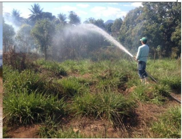
Imagem 05 e 06: Labareta de fogo próximo a fiação de energia. Combate ao fogo feito com apoio de um caminhão pipa.