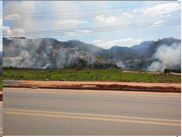
Imagem 03 e 04: Visão parcial da área incendiada. Rodovia passa em frente do terreno.