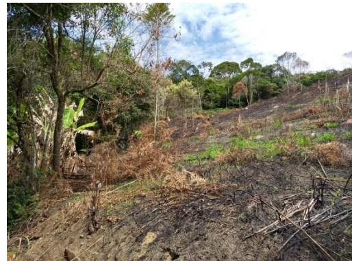
Imagem 01,02, 03 e 04: mostrando parte da área atingida pelo fogo, com vegetação predominante composta por eucalipto, observamos ainda que parte da área já esta colhida.