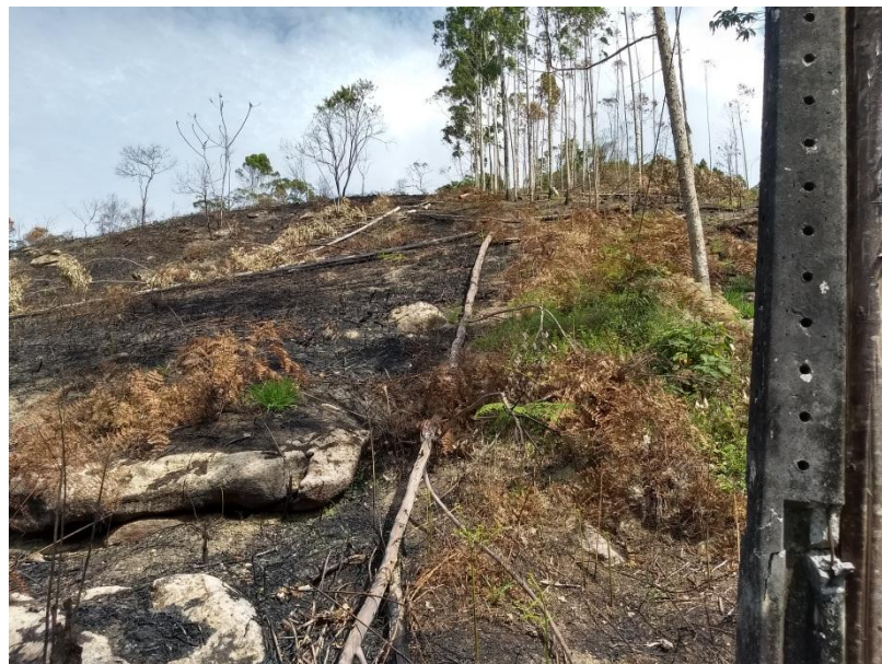
Imagem 05: Mostrando a direita o poste que foi quebrado, possível causa do inicio do incêndio.

Imagem 01,02, 03 e 04: mostrando parte da área atingida pelo fogo, com vegetação predominante composta por eucalipto, observamos ainda que parte da área já esta colhida.