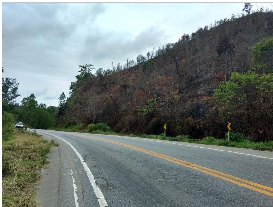
Imagem 01: Destaque para a área atingida pelo incêndio às margens da Rodovia BR 262. Coordenadas UTM 298192 / 7742003 (WGS 84).