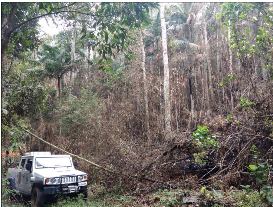
Imagem 02: Fragmento florestal nativo atingido pelo fogo. Coordenadas UTM 297984 / 7741588 (WGS 84).