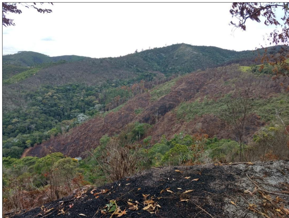
Imagem 03: Área afetada pela passagem do fogo. Coordenadas UTM 298239 / 7741668 (WGS 84).