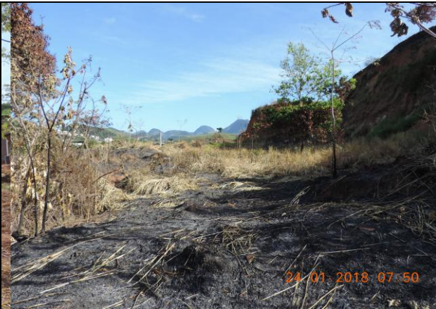
Imagem 05 e 06: Casas populares ao fundo. Visão parcial da área queimada.