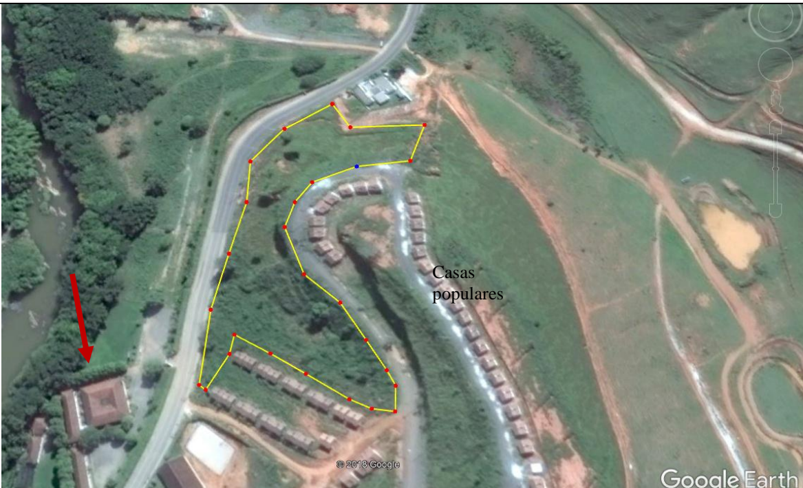
IMAGEM 02 (google Erth): Linha em amarela indicando a área incendiada e seta em vermelha indicando o asilo da cidade de castelo que fica próximo ao local do incêndio. Na imagem pode ser observado as casas populares ao redor da área atingida pelo incêndio.