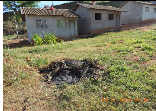
Imagem 03 e 04: Visão parcial da área incendiada e vestígio de queima de lixo no local.