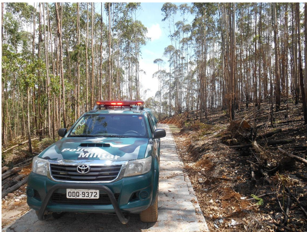
Imagem 02: Imagem do local de ocorrência do incêndio florestal.