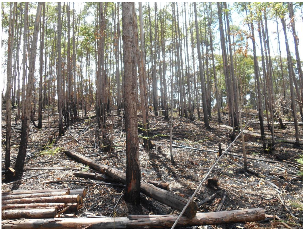
Imagem 01: Área de vegetação exótica ( Eucalyptus spp ) atingida pelo incêndio.