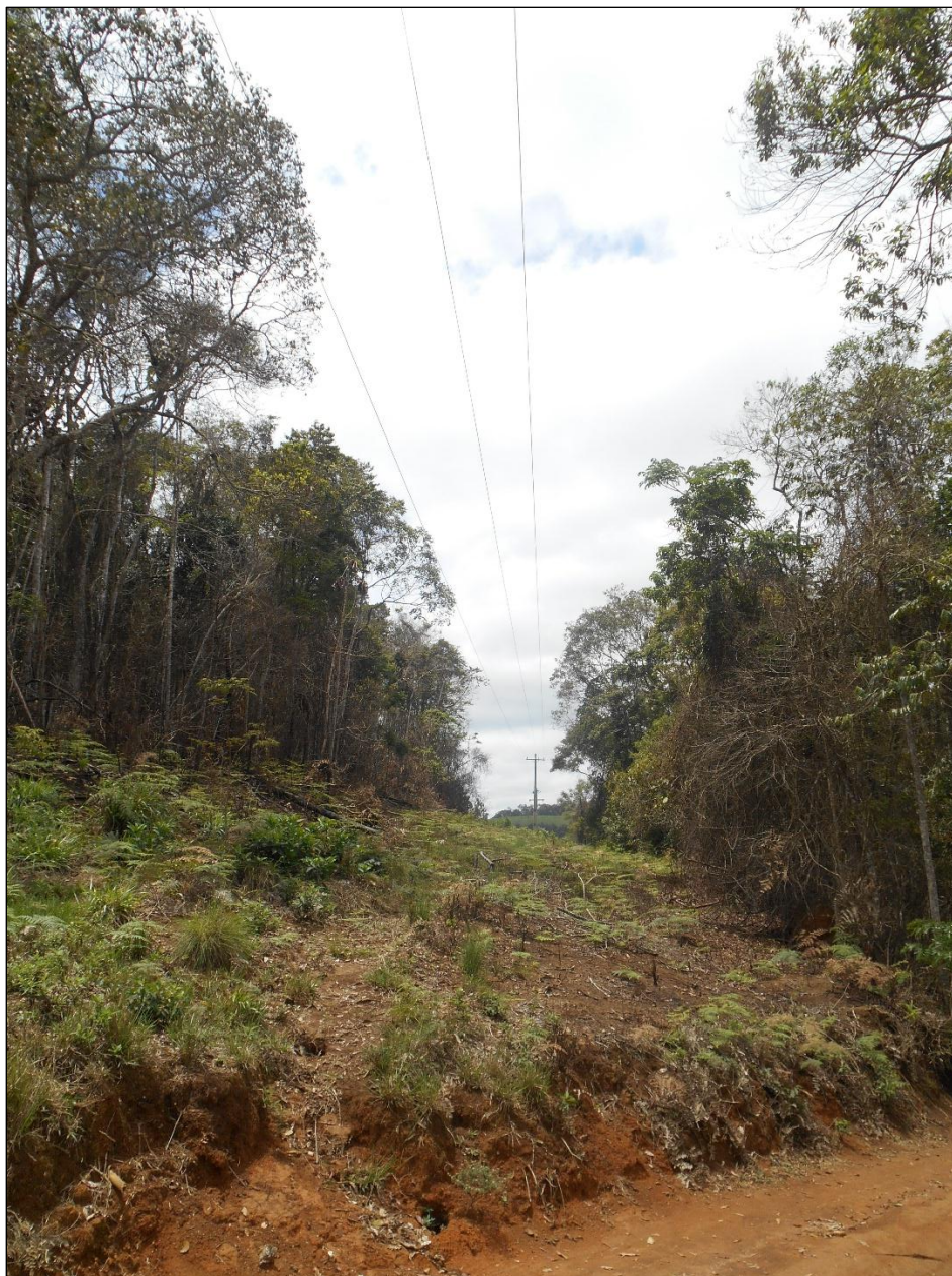
Imagem 04: Linha de transmissão onde provavelmente iniciou o incêndio florestal.