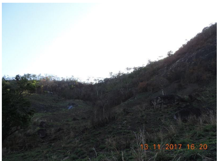
Figuras.01 a 06: Vista geral da área atingida pela queimada.