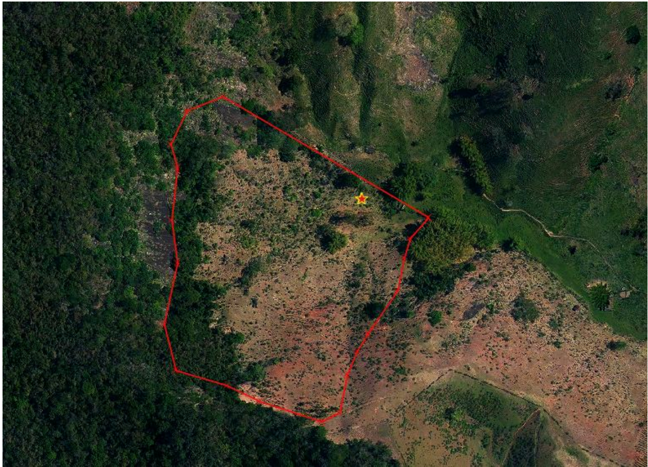
Figura 7. Imagem aérea aproximada do polígono do incêndio florestal, a linha em vermelho indica aproximadamente o polígono que foi queimado (base de dados IEMA 2012/2015).