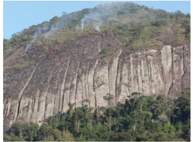
Figura 02: Situação da área no dia 30/09/17.