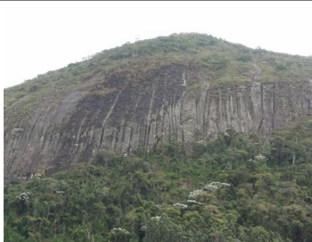
Figura 03: Situação da área no dia 01/10/17. Fogo controlado pela chuva.