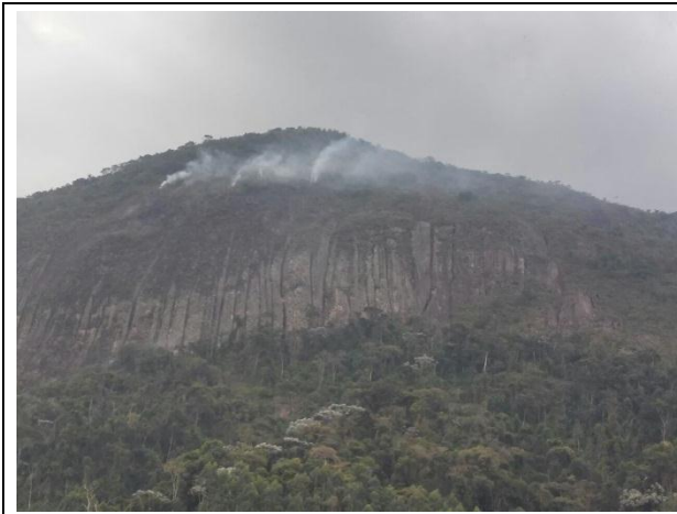
Figura 01: Situação da área no dia 29/09/17. Frente de fogo com propagação lenta.