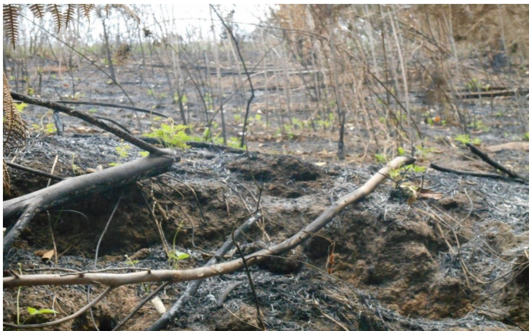
Fig.02: Vista de outro ângulo do incêndio ocorrido.