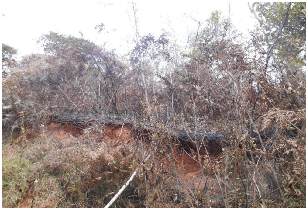
Fig.01: Imagem do local de ocorrência do incêndio florestal.