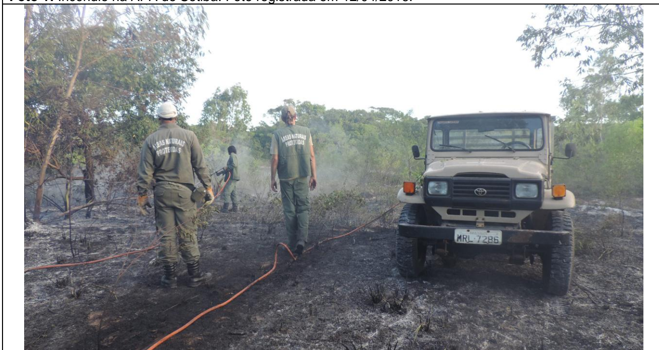
Foto 2: Equipe do IEMA em combate. Foto registrada em 12/04/2016.