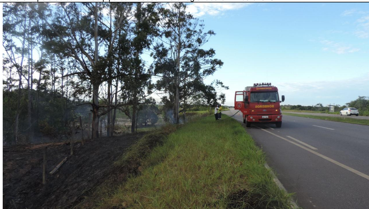
Foto 4: ABT e equipe do Corpo de Bombeiros. Foto registrada em 12/04/2016.