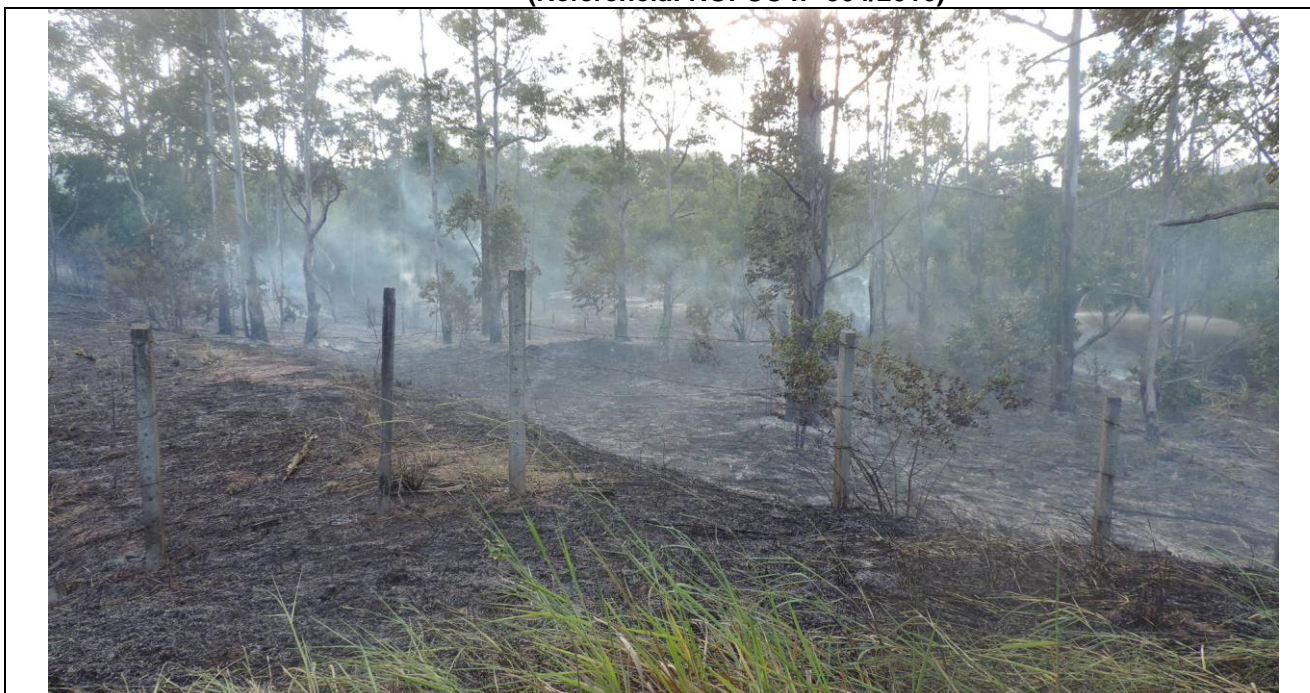
Foto 1: Incêndio na APA de Setiba. Foto registrada em 12/04/2016.