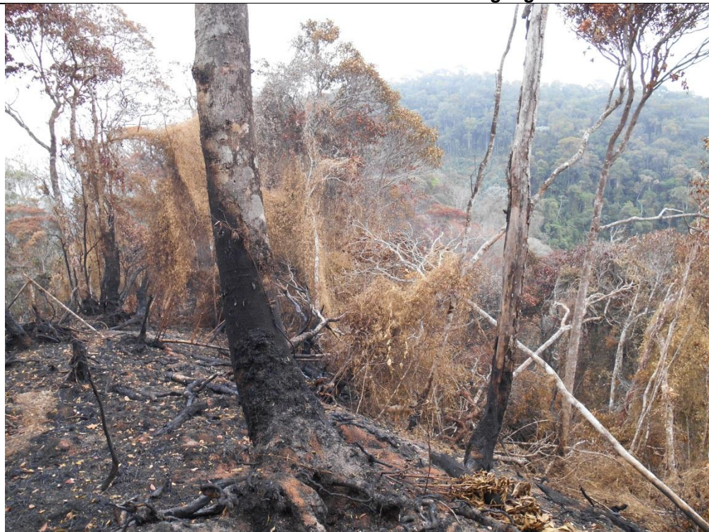
Foto 02: Vista da área de ocorrência do incêndio na coordenada geográfica WGS 84 296046/7732026