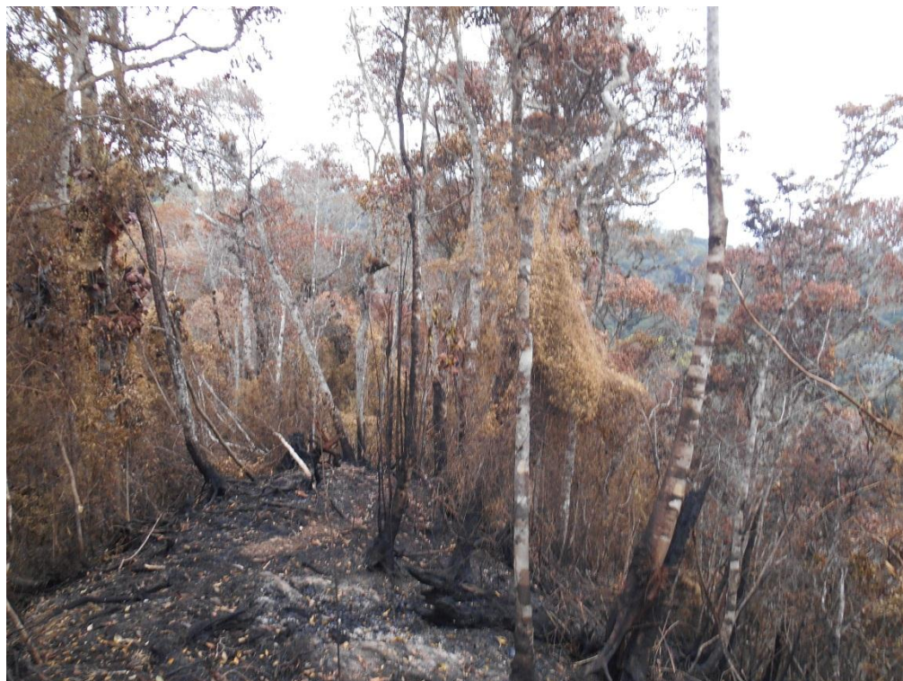
Foto 01: Vista da área de ocorrência do incêndio na coordenada geográfica WGS 84 295737/7732120