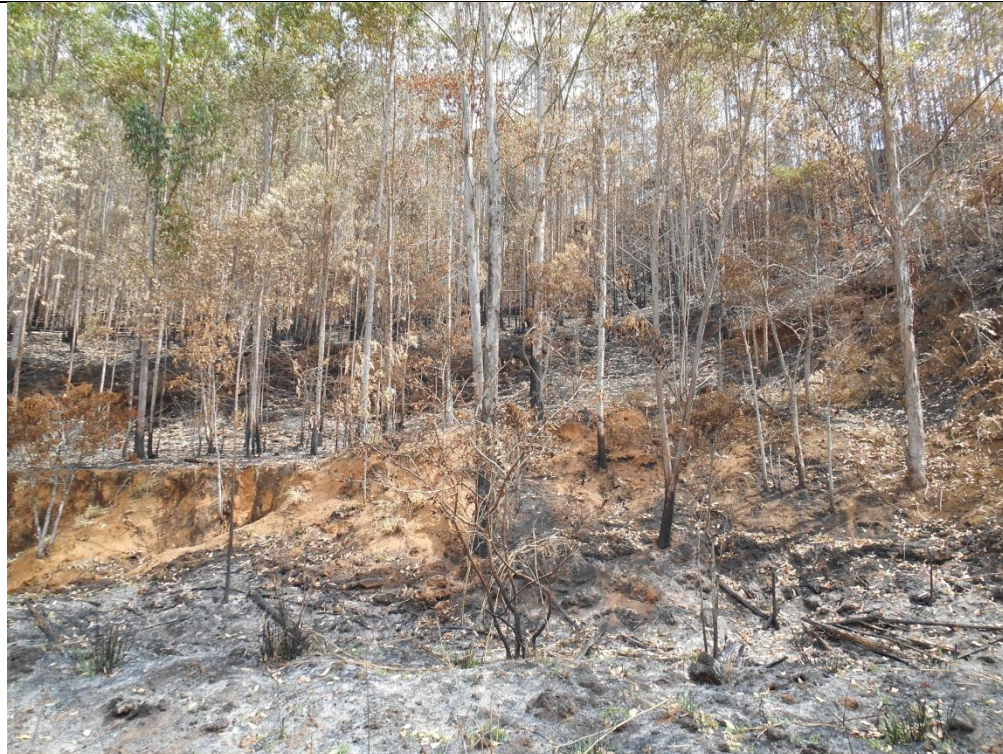
Foto 02: Vista da área de ocorrência do incêndio na coordenada geográfica WGS 84 299273/7741785