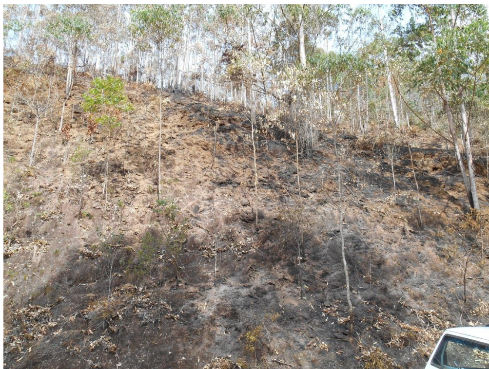
Foto 01: Vista da área de ocorrência do incêndio na coordenada geográfica WGS 84 299266/7741797