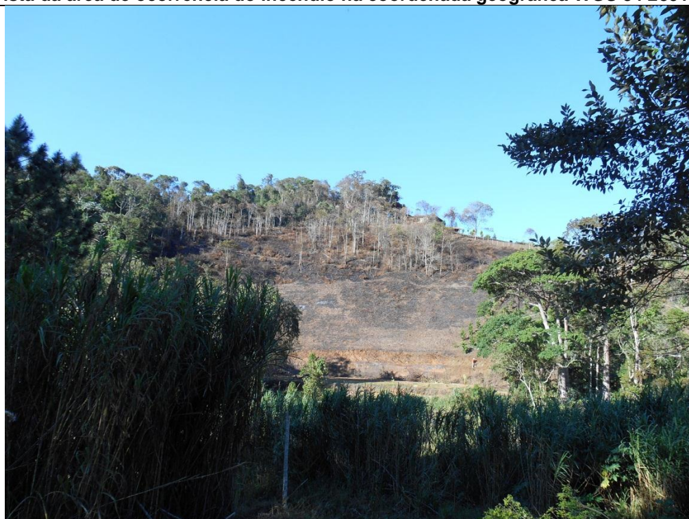
Foto 02: Vista da área de ocorrência do incêndio na coordenada geográfica WGS 84 289104/7736284