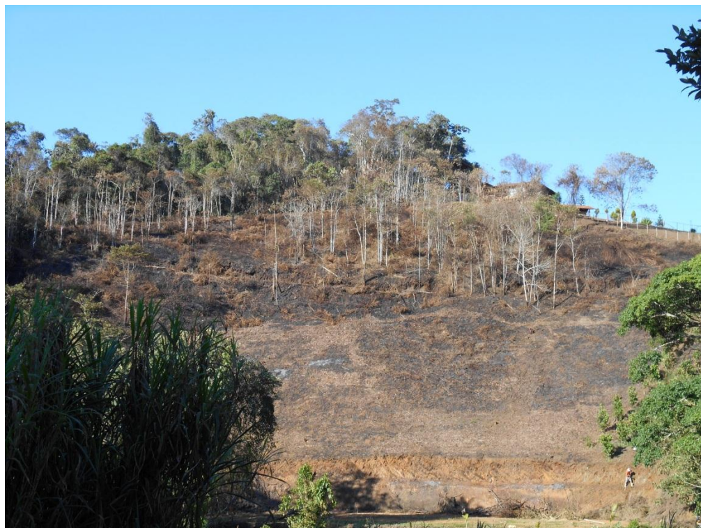
Foto 01: Vista da área de ocorrência do incêndio na coordenada geográfica WGS 84 289104/7736284