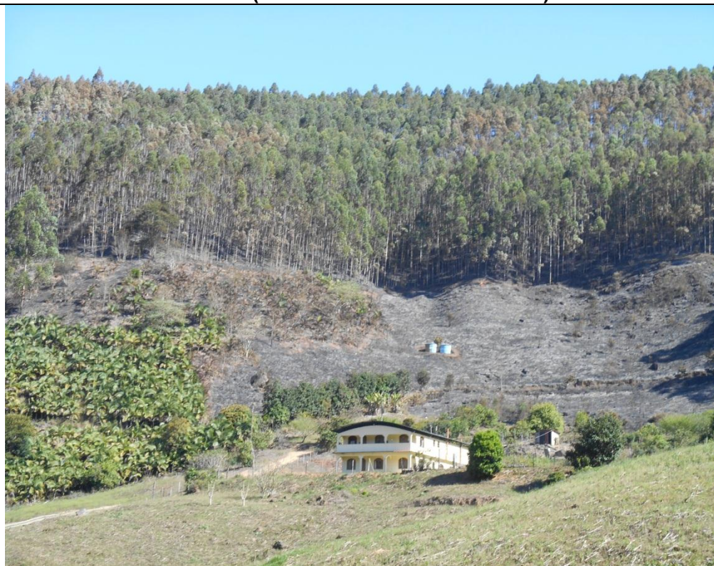
Foto 01: Vista da área de ocorrência do incêndio na coordenada geográfica WGS 84 29191/7747418