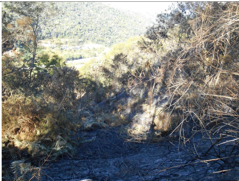
Foto 02: Vista da área de ocorrência do incêndio na coordenada geográfica WGS 84 28171/7747529