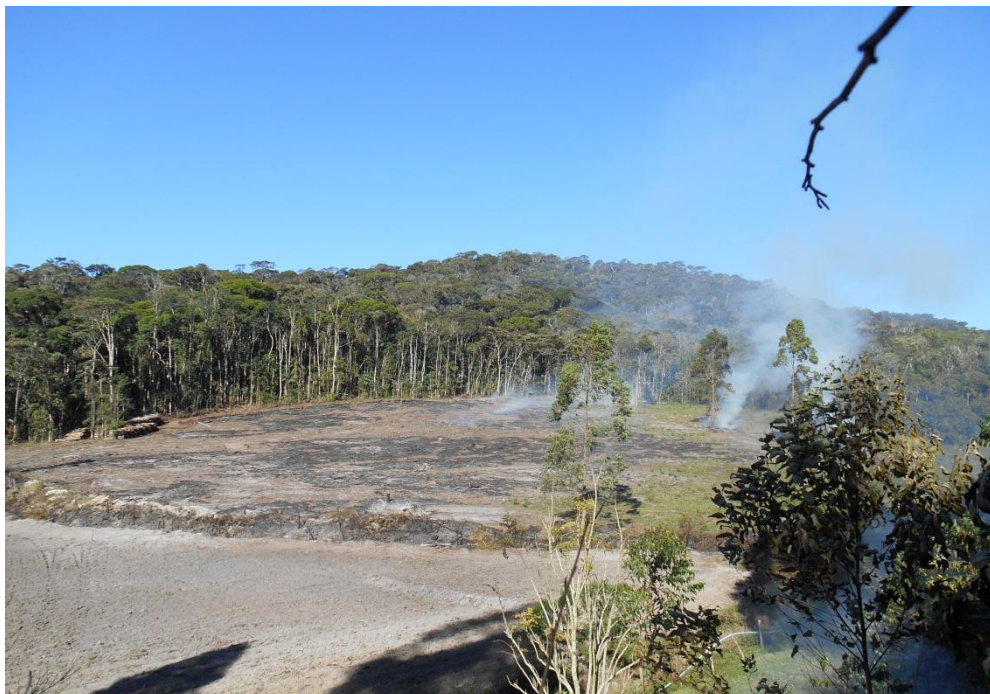
Foto 01: Vista da área de ocorrência do incêndio na coordenada geográfica WGS 84 296968/7740368