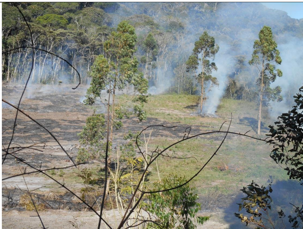
Foto 02: Vista da área de ocorrência do incêndio na coordenada geográfica WGS 84 297006/7740374