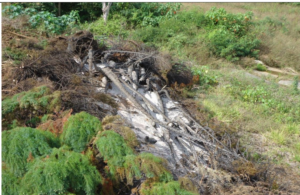
Foto 01 e 02: Vista da área de ocorrência do incêndio na coordenada geográfica WGS 84 288477/7741291.