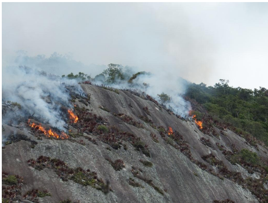
Foto 01: Vista da área de ocorrência do incêndio na coordenada geográfica WGS 84 285603/7740448