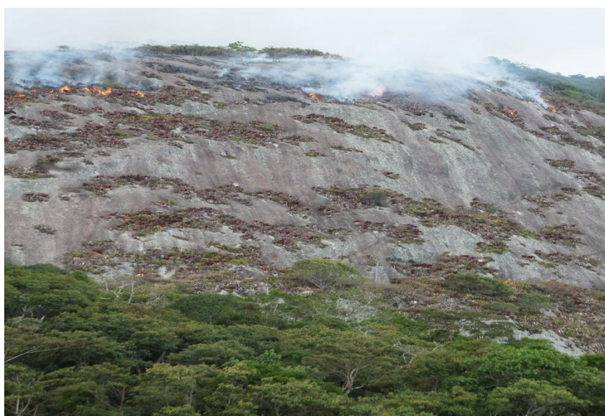
Vista da área de ocorrência do incêndio na coordenada geográfica WGS 84 295969/7740369