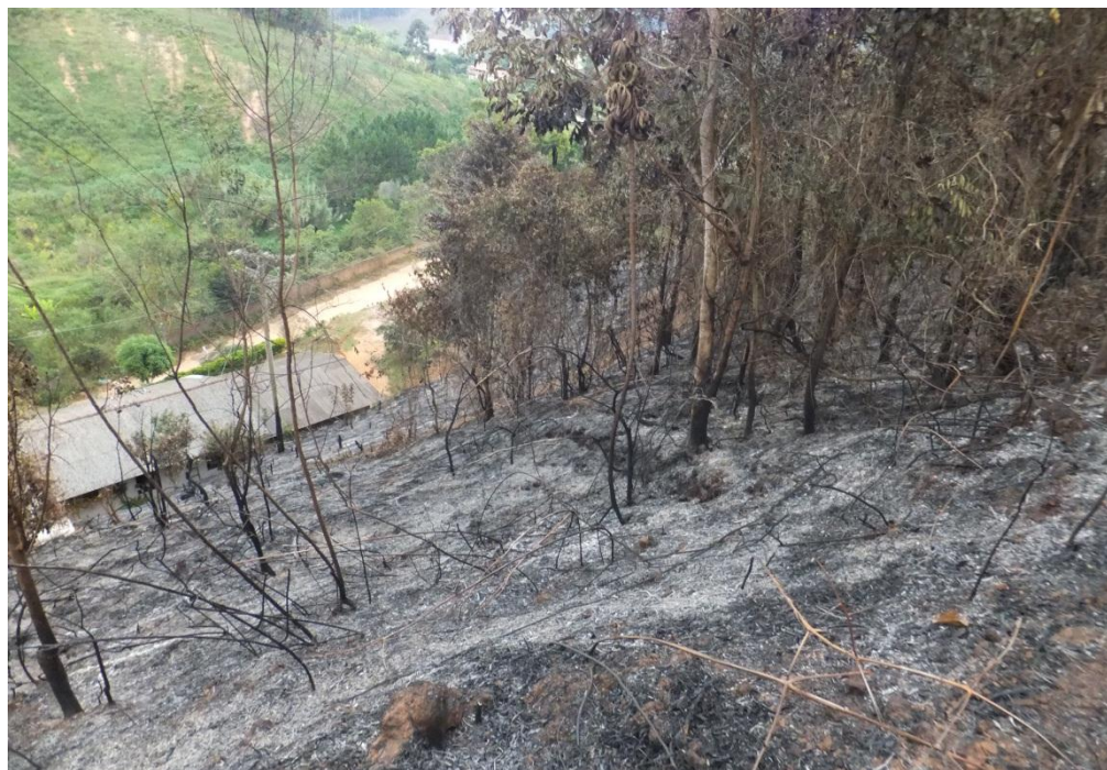
Foto 01: Vista da área de ocorrência do incêndio na coordenada geográfica WGS 84 288583/7738025