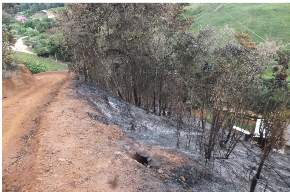
Vista da área de ocorrência do incêndio na coordenada geográfica WGS 84 288562/7737979