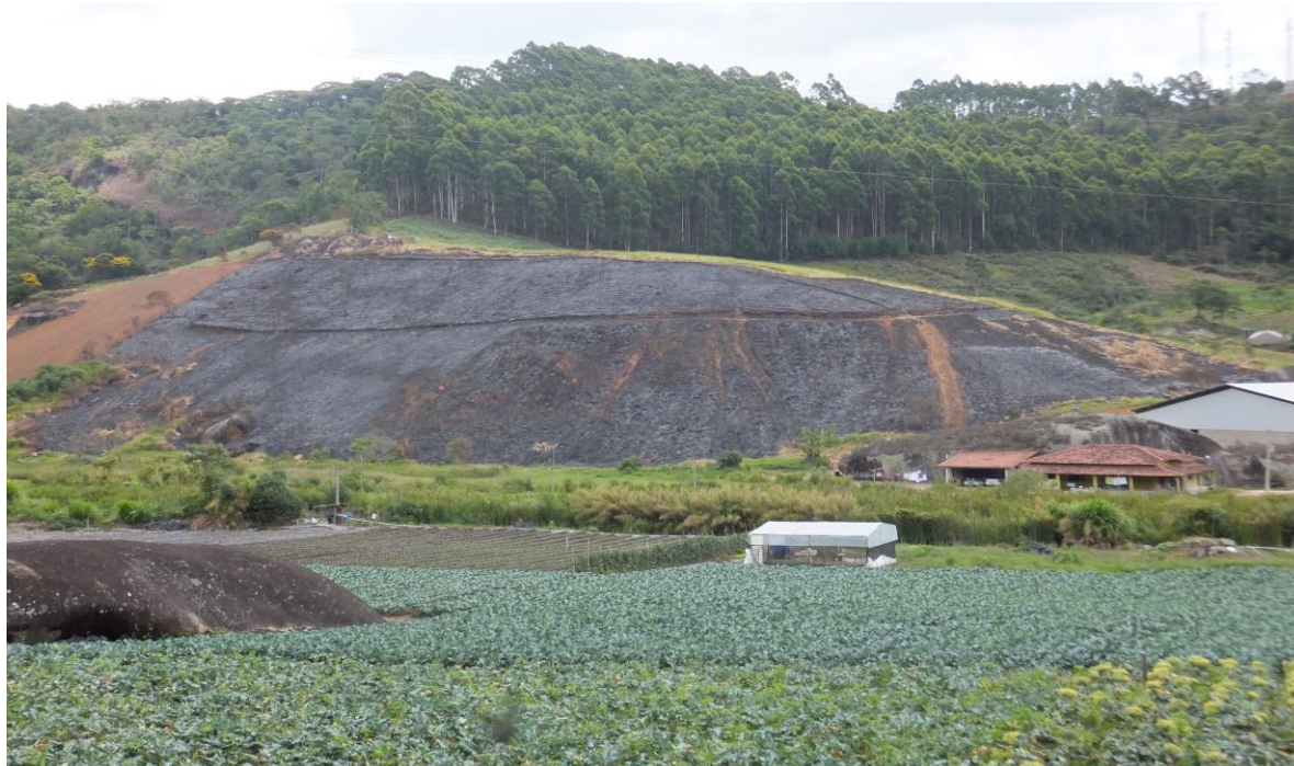
Vista parcial da área do incêndio, tendo ao fundo lado esquerdo a mata e ao direito eucalipto com mata