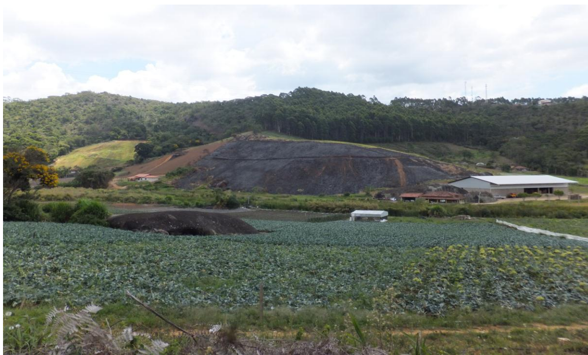
Vista do local do incêndio, e ao fundo a mata de eucalipto e vegetação nativa bem próximas a torre