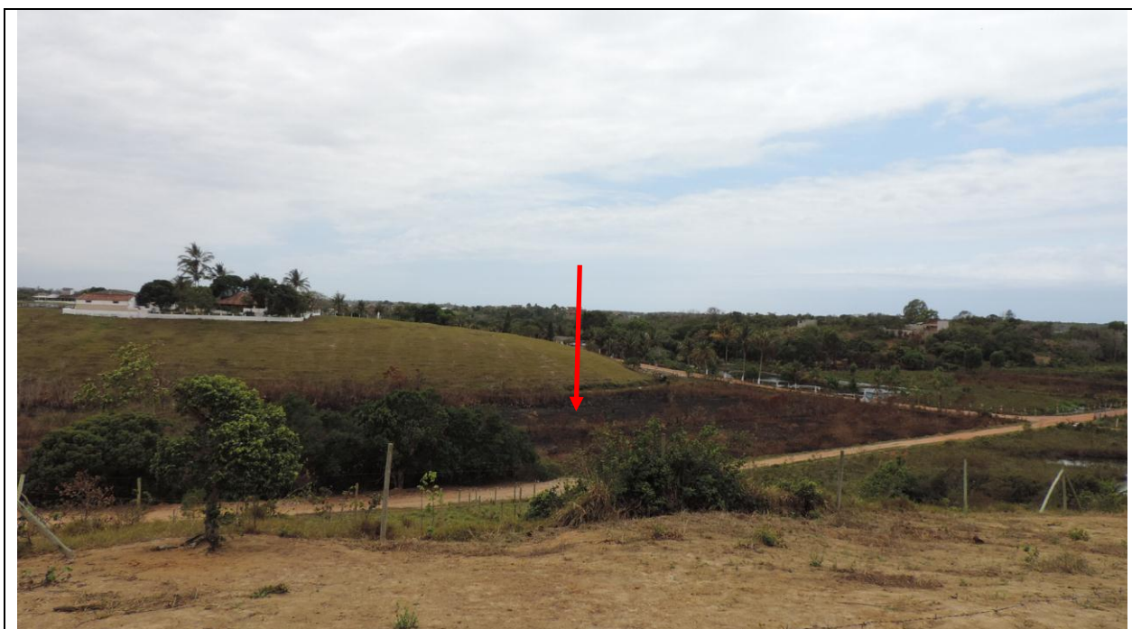
Figura 1: Foto tirada em 26/10/2015, pela GA Fernanda Severino. Área 1.