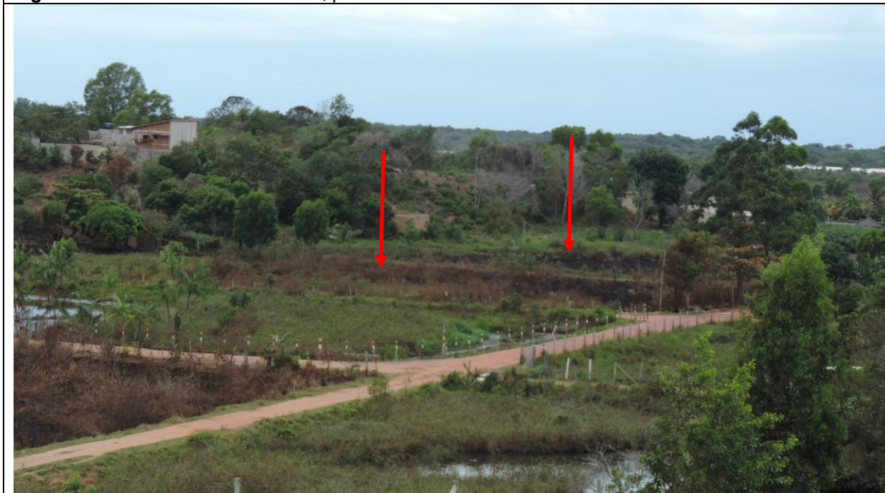
Figura 2: Foto tirada em 26/10/2015, pela GA Fernanda Severino. Dois lotes queimados (áreas 2 e 3)

----- Fernda Severino – 2984687 Guarda Ambiental