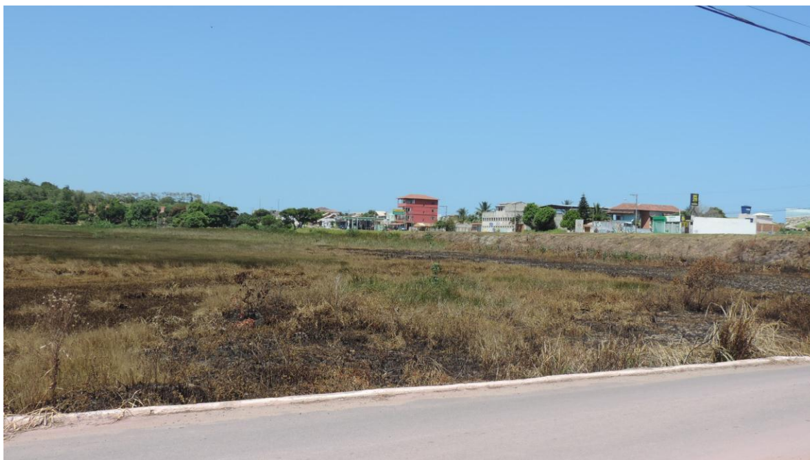
Foto 1: Incêndio em frente ao Thermas. Foto registrada 07/01/2016.