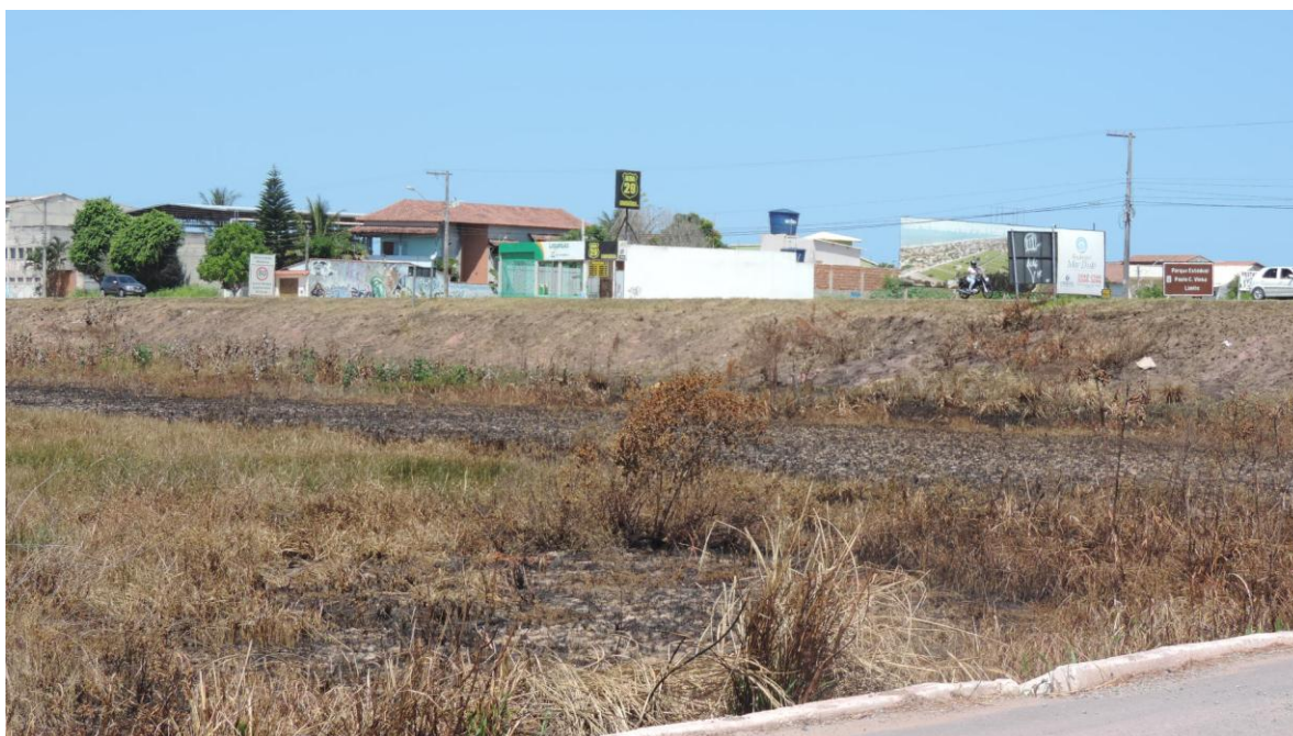
Foto 2: Incêndio em frente ao Thermas. Foto registrada 07/01/2016.

----- Walter Bruno Schuhmacher Dietrich Gestor PEPCV e APA de Setiba