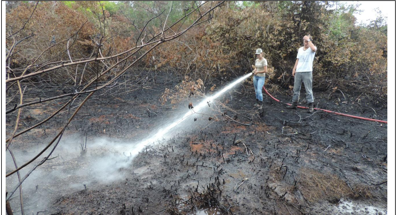
Figura 2: xxxxxxx. Coordenadas UTM: Lon. 349192 Lat. 7720591.