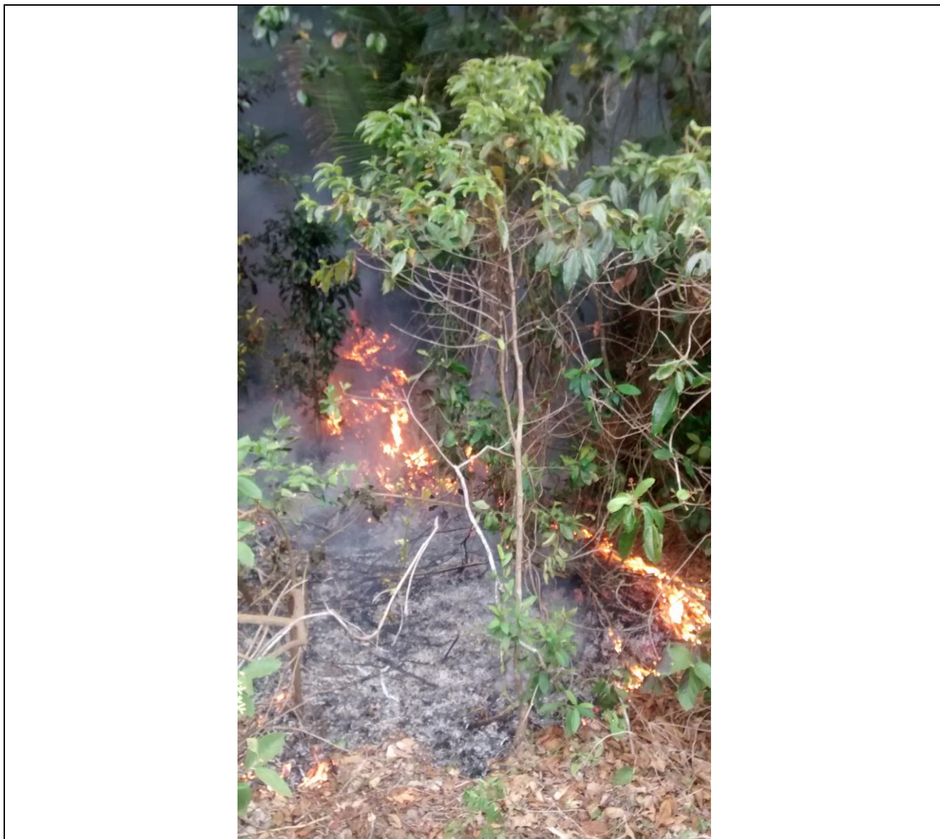
Figura 1: Fogo atinge vegetação rasteira na mata de tabuleiros. Foto tirada em 05/02/2015, pelo ADARH Flávio Guerra. Coordenadas UTM: Lon. 349767 Lat. 7720636.