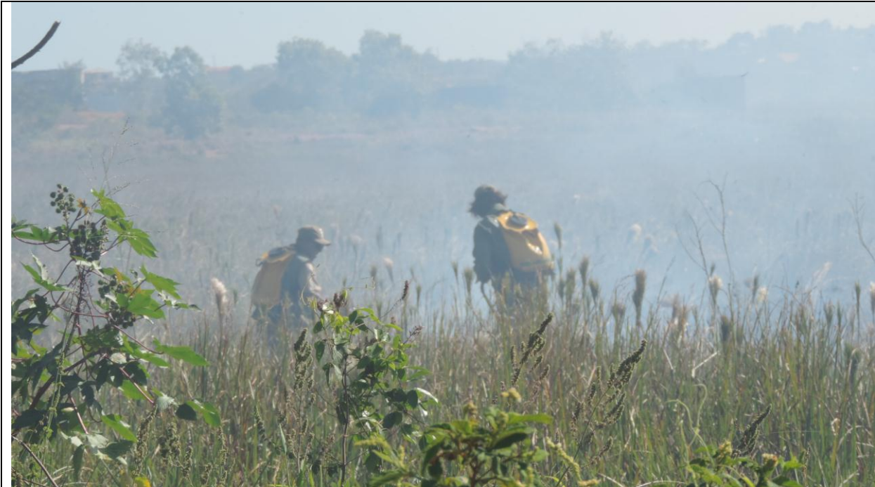
Legenda: Combate direto realizado pela equipe do PEPCV.