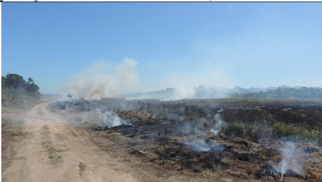
Legenda: Alagado entre os loteamentos Aldeia do Mar e Ouro Branco, lado esquerdo.