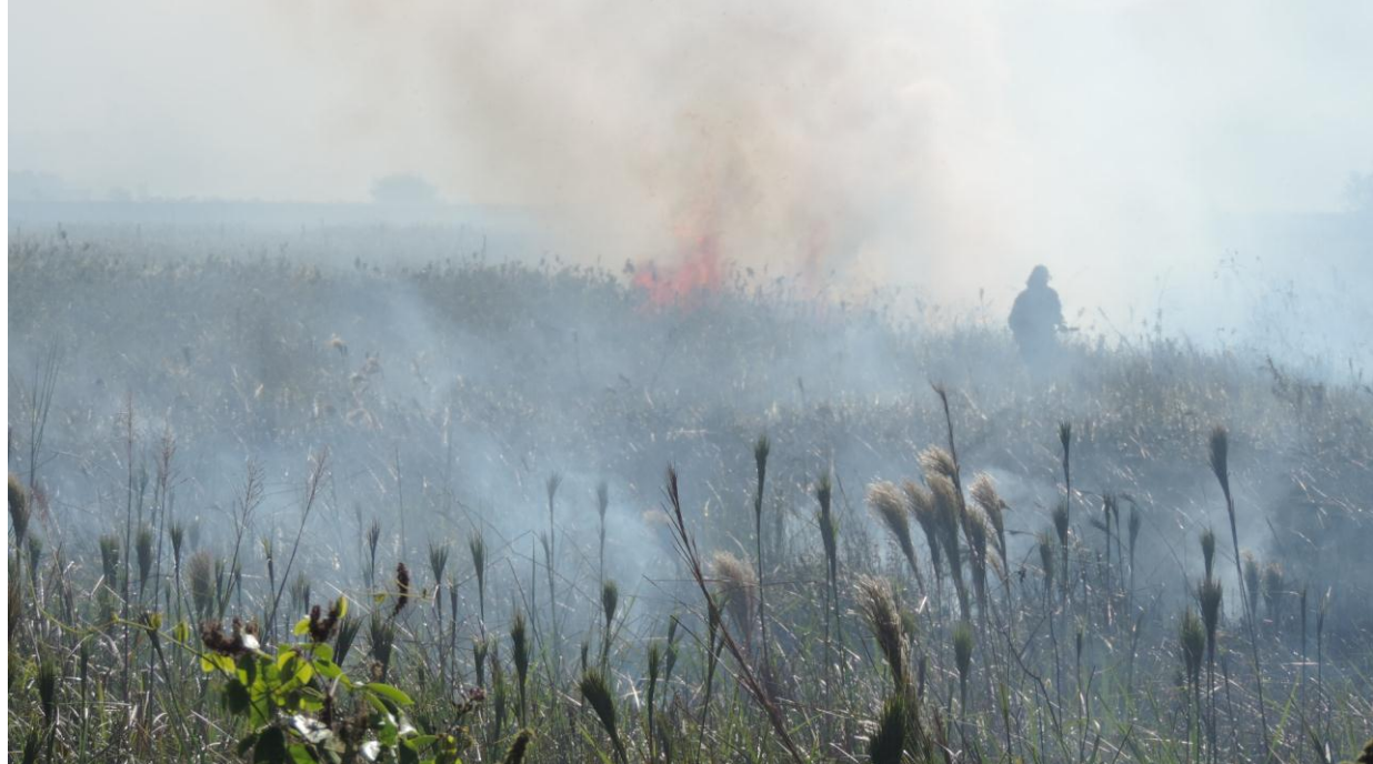
Legenda: Combate direto realizado pela equipe do PEPCV.