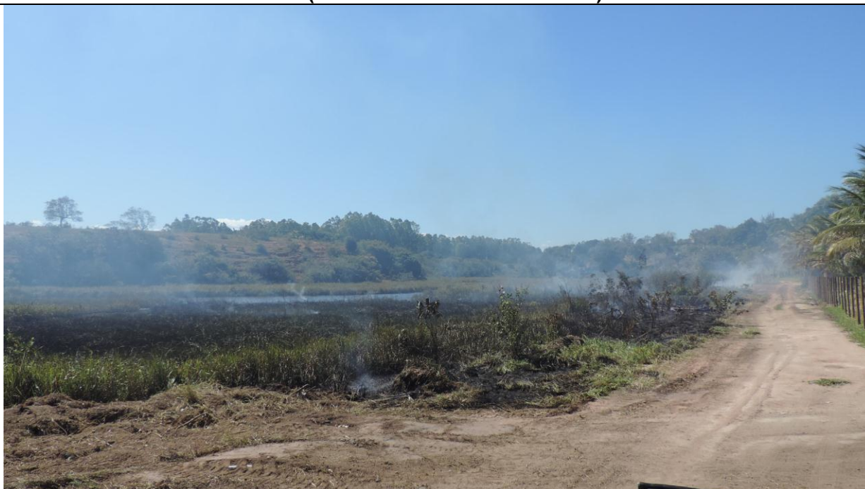
Legenda: Alagado entre os loteamentos Aldeia do Mar e Ouro Branco, lado direito.