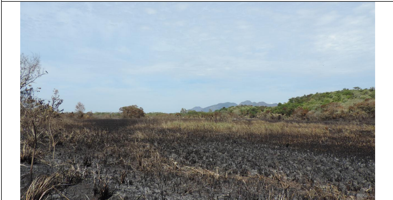
Legenda: Foto tirada em 04/02/2015 às 08:50, pela Guarda Ambiental Fernanda Severino. Coordenadas UTM: Lon. 0352223 Lat. 7723724