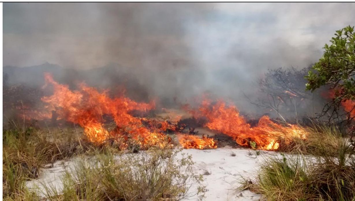
Legenda: Foto tirada em 03/02/2015 às 11:02. Coordenadas UTM: Lon. 0352223 Lat. 7723724