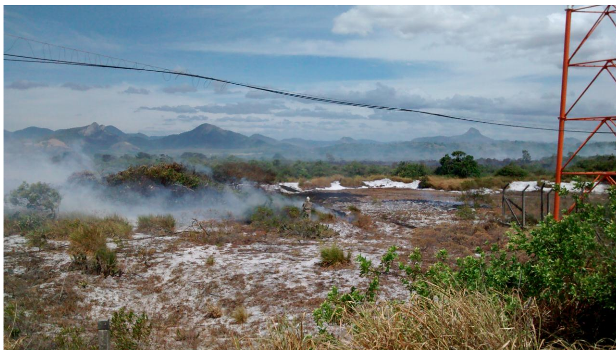
Legenda: Foto tirada em 03/02/2015 às 10:42, pela Guarda Ambiental Fernanda Severino. Coordenadas UTM: Lon. 0352223 Lat. 7723724