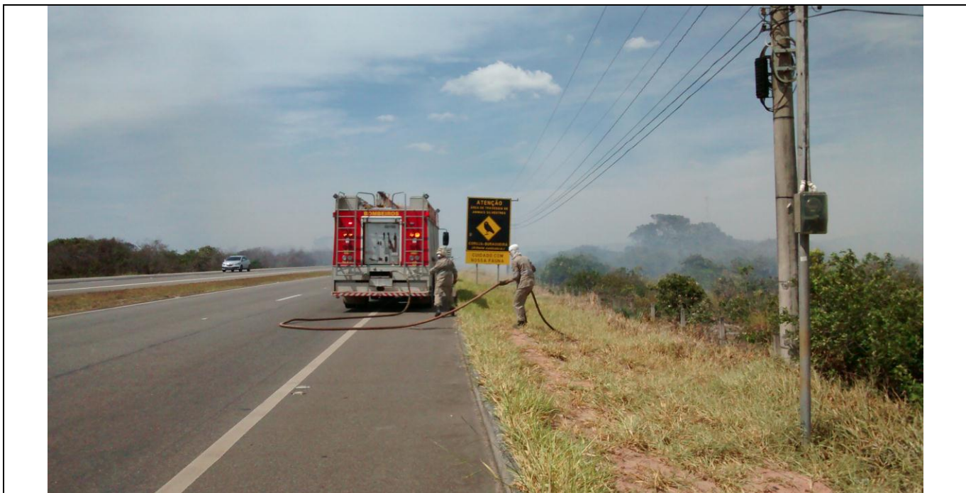
Legenda: Foto tirada em 03/02/2015 às 10:42, pela Guarda Ambiental Fernanda Severino. Coordenadas UTM: Lon. 0352223 Lat. 7723724