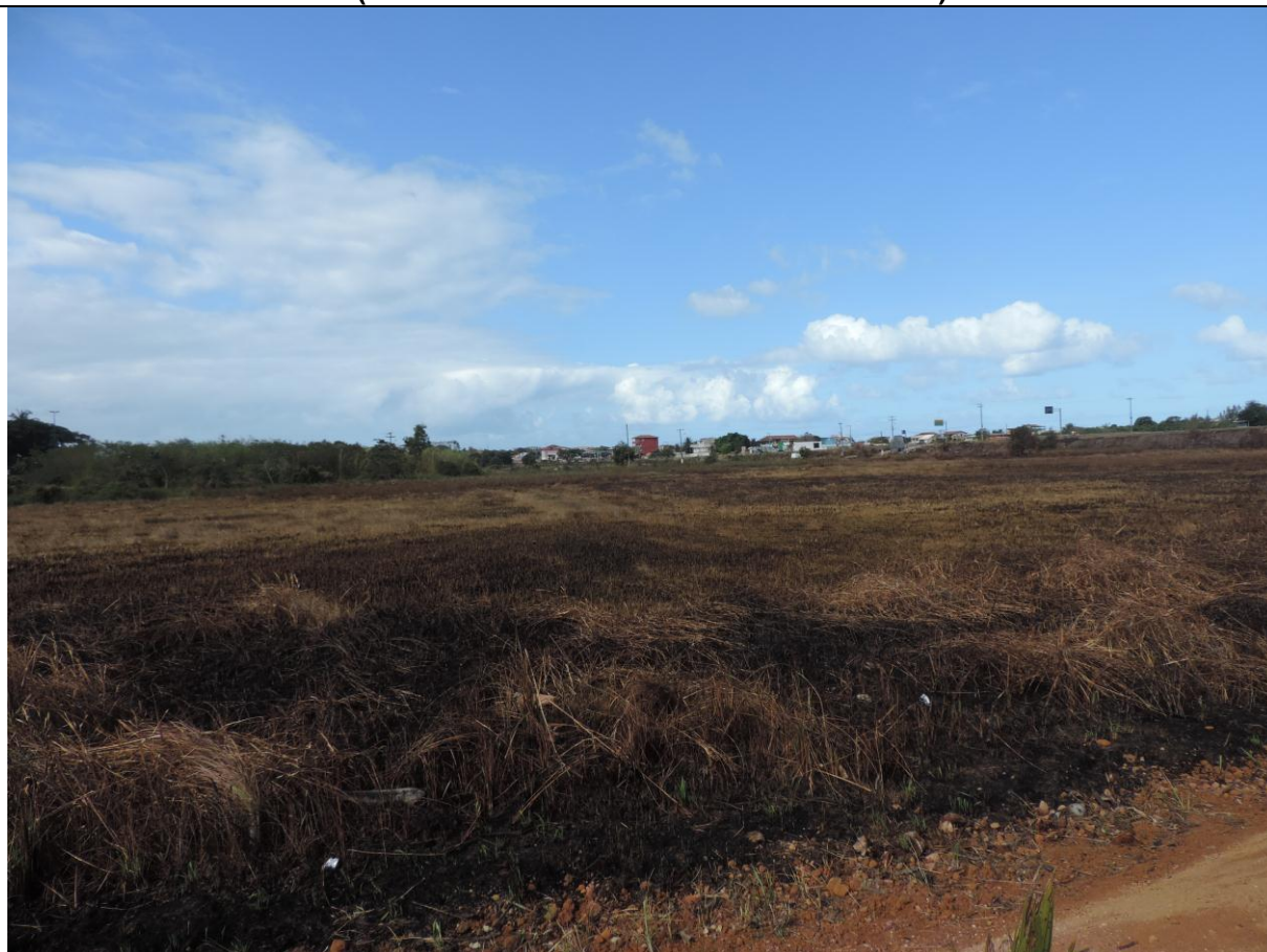
Legenda: O fogo atingiu extensa área composta de alagados.