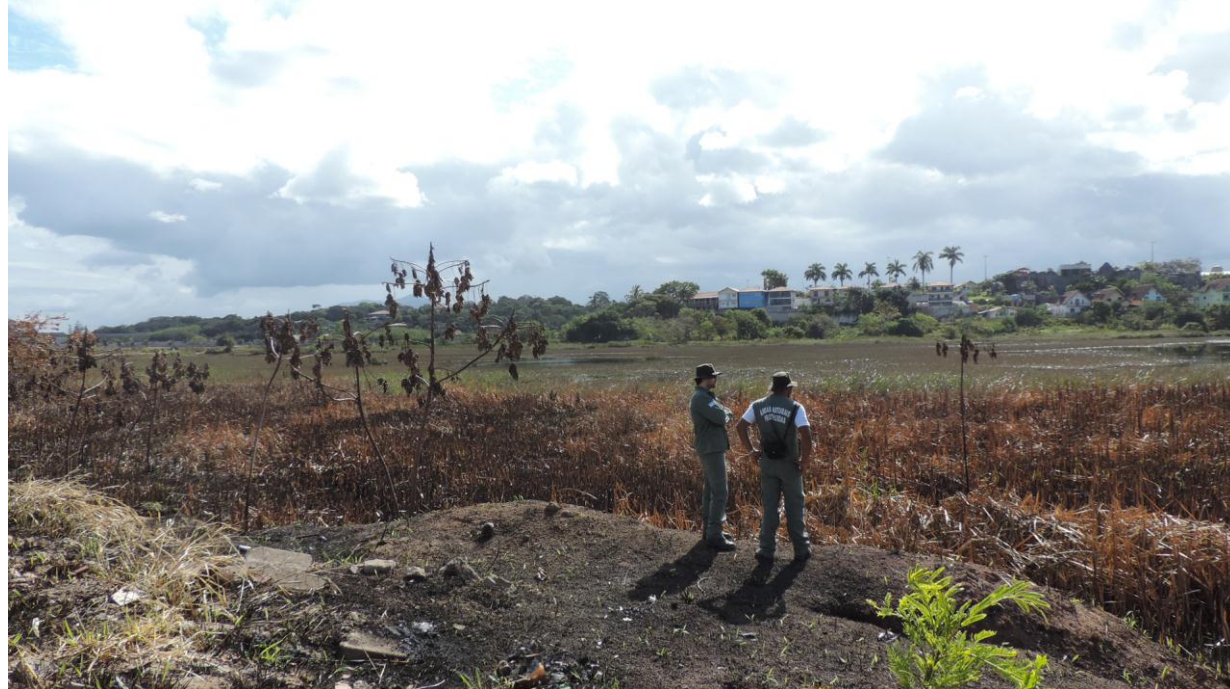
Legenda: Equipe do IEMA observa área alagada atingida pelo fogo. Vegetação atingida era predominantemente composta de brejo herbáceo.