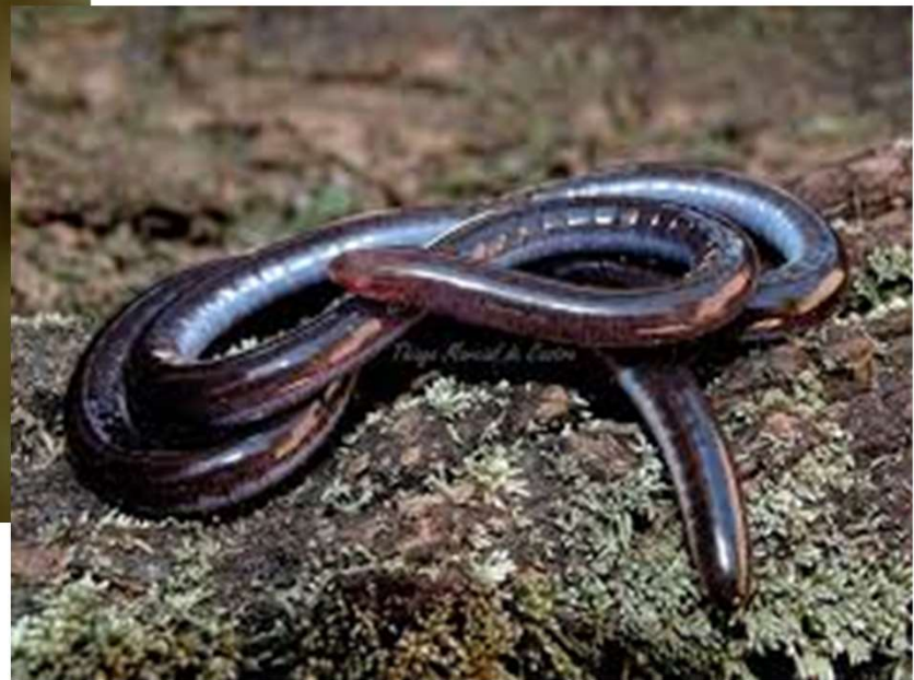
Luetkenotyphlus fredii - Cobra cega Descoberto pela equipe coordenada pela Dra. Jane Oliveira