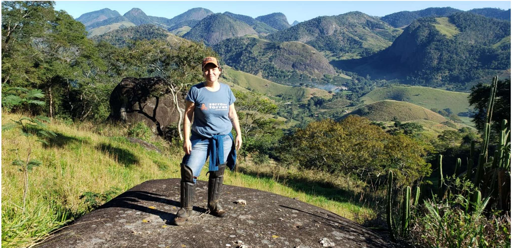
Vista do alto da Pedra do Espanta Moleque - Muqui - ES - 980 metros de altitude