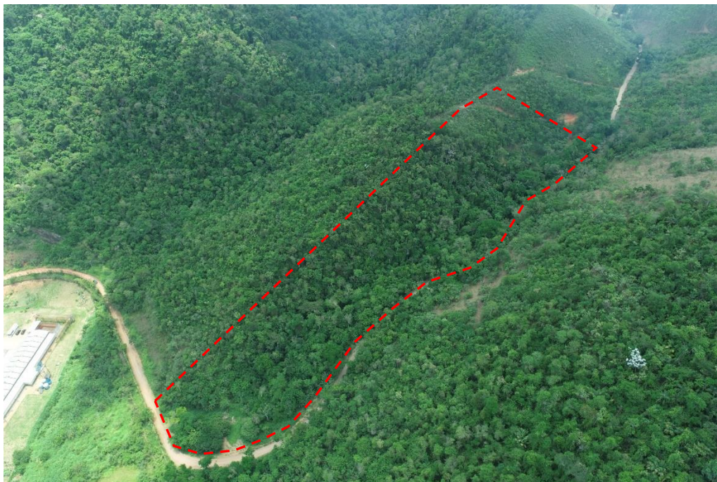
Figura 3. Imagem de drone com delimitação ilustrativa da área da RPPN.